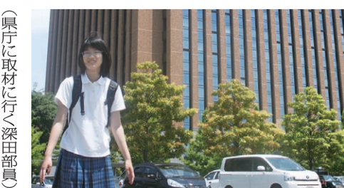
(県庁に取材に行く深田部員)