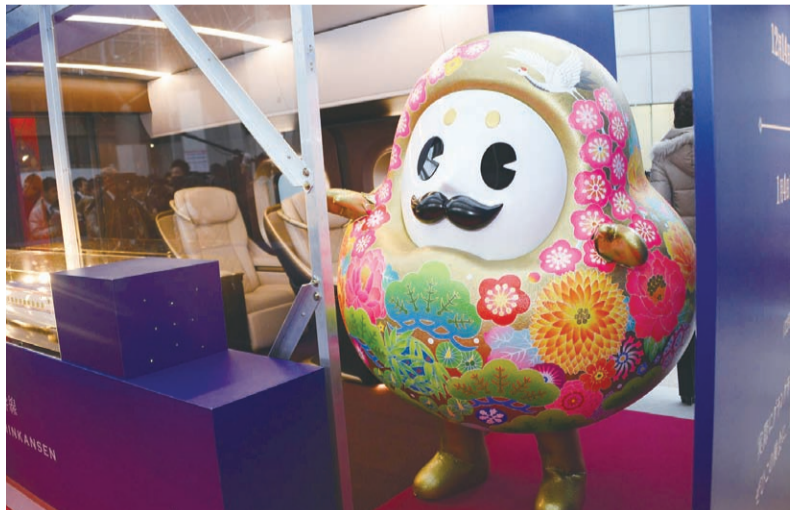
イベントで活躍するひやくまんさん

石川県の北陸新幹線開業PRマスコットキャラクターとして昨年の10月末に完成しました。全国に名前の募集を行ったところ、約5000通の応募があり、その中から決定しました。ちなみになぜ「ひやくまんさん」という名前にしたかというと、加賀百万石をイメージさせ、さらにひらがな表記にすることで親しみやすくするためです。大きさは横の幅が130cm、前後の幅は117cm、重さは22kgです。かなり大きいのでせまい入り口は通れません。また乗り物にも乗れないので大変なところもあります。