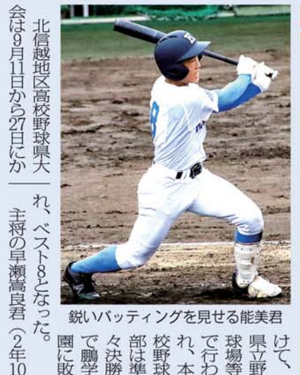
鋭いバッティングを見せる能美君