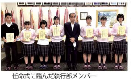
任命式に臨んだ執行部メンバー