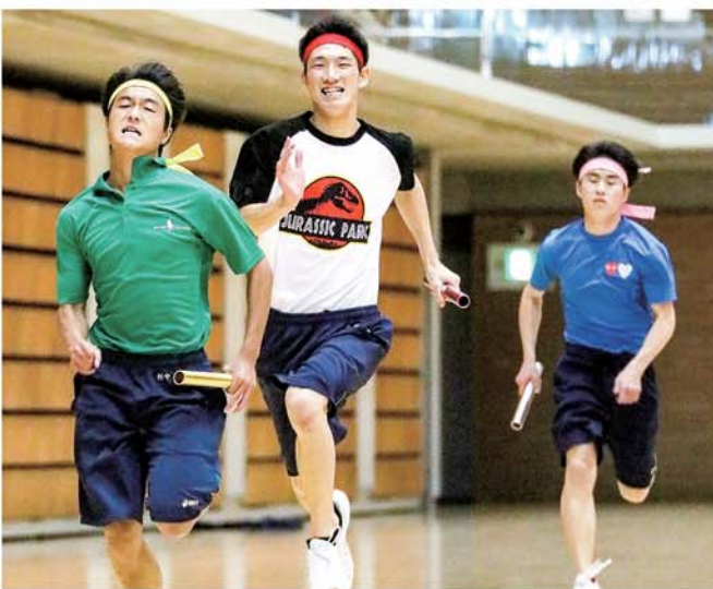
リレーで疾走する生徒たち