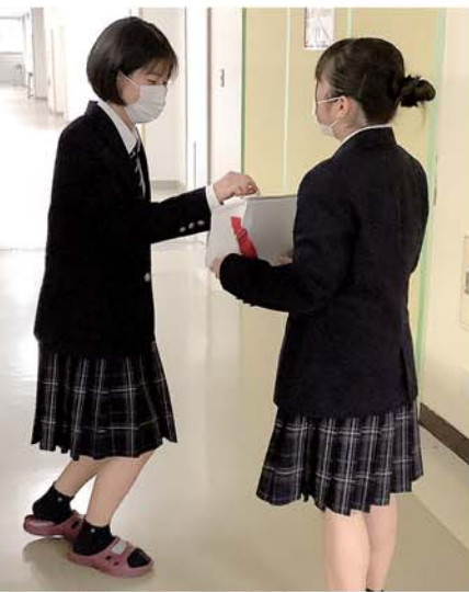
募金活動に励む執行部メンバー

もいる。一方、日本の領土や領海を守る上で必要な自衛隊を、憲法に明確に位置付けるべき、という主張もある。いずれも私たちの生活に深く関わっていることだけに、その重要な選択についての自身の意志を持つことは、人生において必要なことだろう。