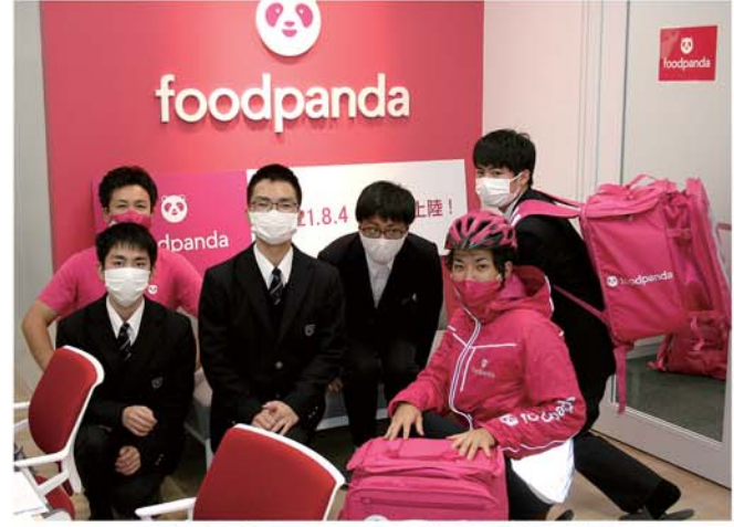
フードパンダのスタッフや配達員の方と記念撮影

「コロナ禍の集ぞもい需要が追い風となり、フードデリバリー市場が急成長している。新聞部では石川県内で展開する業界大手2社に取材を行い、市場拡大の実態と今後の方向性を探った。」