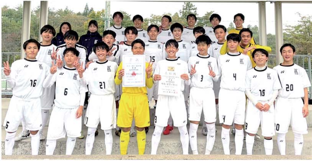
優勝の賞状を手に笑顔の選手たち