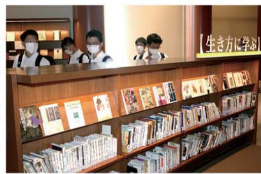
テーマ別に並べられた書籍

うに、加賀五彩を用いた方角ごとのゾーン分けがなされている。「生き方に学ぶ」「暮らしを広げる」等の12のテーマ別に図書が並べられ、円形の通路を巡るうちに、思いがけない本の出会いが演出されるような構造になっている。