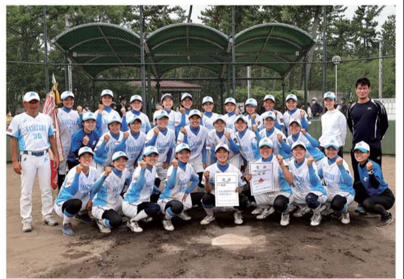
優勝旗を手に笑顔の選手たち