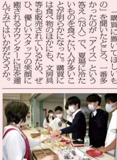
生徒でにぎわう昼休みの購買

購買に対する生徒の意識を探るため、新聞部では5月にアンケートを実施し、約620人から回答を得た。それによると、「購買を利用したことがある」と答えた生徒は、1年生が58%、2年生が70%、3年生が96%に上った。