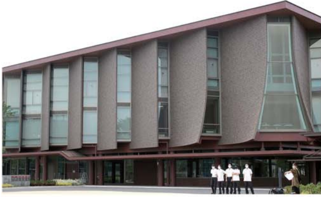
「本をめくる」をイメージした外観