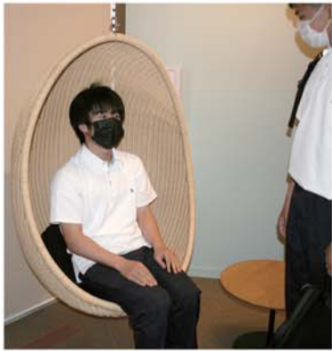
ユニークな椅子が数多くある

約30万冊の本が並び、国内でも有数の規模を誇る石川県立図書館は、金沢市小立野に移転オープンした。建物の中には、古代ローマの円形劇場を思わせる巨大な空間が広がり、おしゃれなカフェやさまざまな体験・交流コーナーも併設。新館では新図書館を取材し、本を読むだけでなくとまらぬ、「知の殿堂」の魅力を探った。