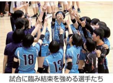
試合に臨み結束を強める選手たち