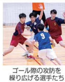
ゴール際の攻防を繰り広げる選手たち

県高校総体ハンドボール競技が6月2日から5日にかけて金沢市中央市民体育館で行われ、本校ハンドボール部は、2回戦で準優勝校の金市工業に敗れ、ベスト8となった。